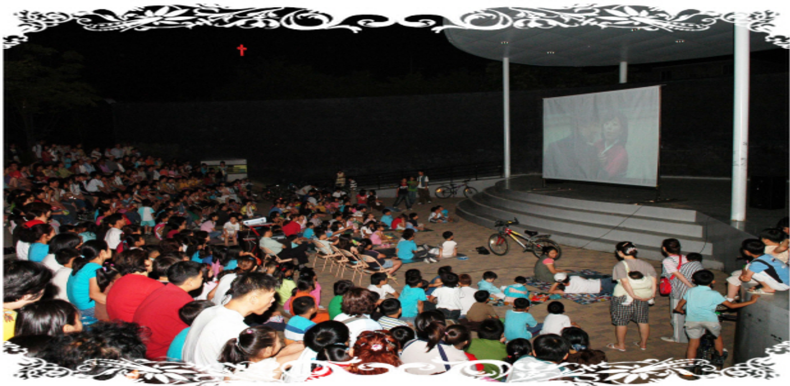
【 은데미예술마당 영화상영 】