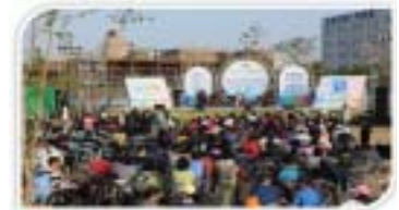
오정대공원 동호회 연주