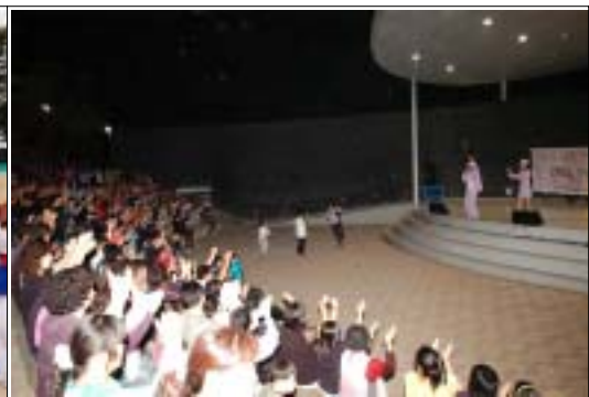
《 여월초교 풍물단 지역축제 초청공연 》