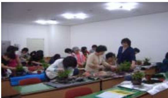
여성문화교실 실내조경 학습장면