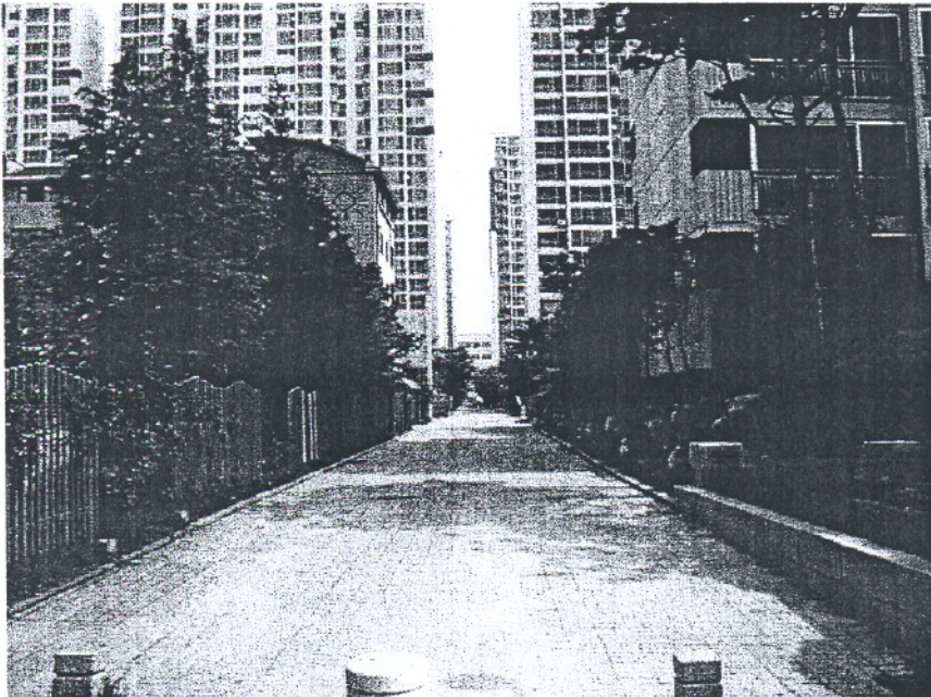
보안등이 없는 보행자 통로