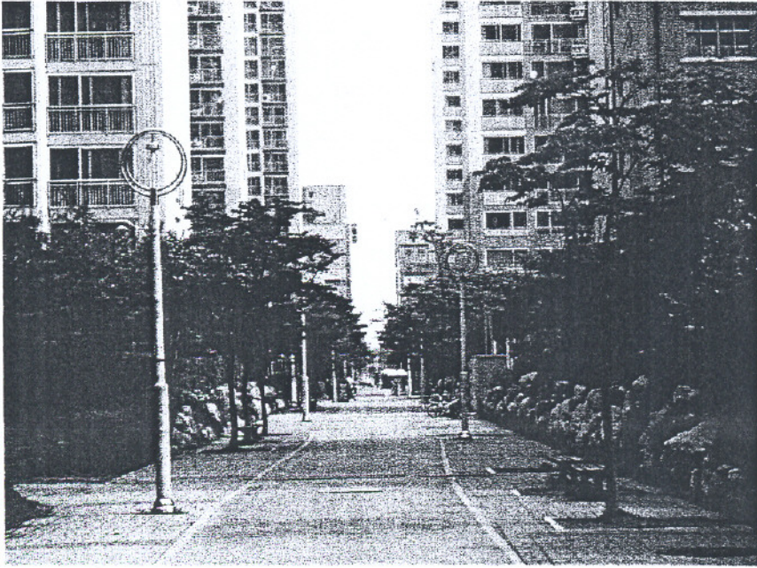
보안등이 있는 보행자 통로