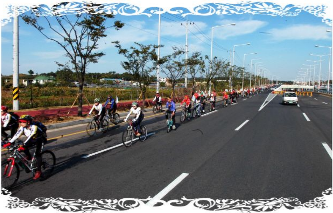
【 오정큰길 】