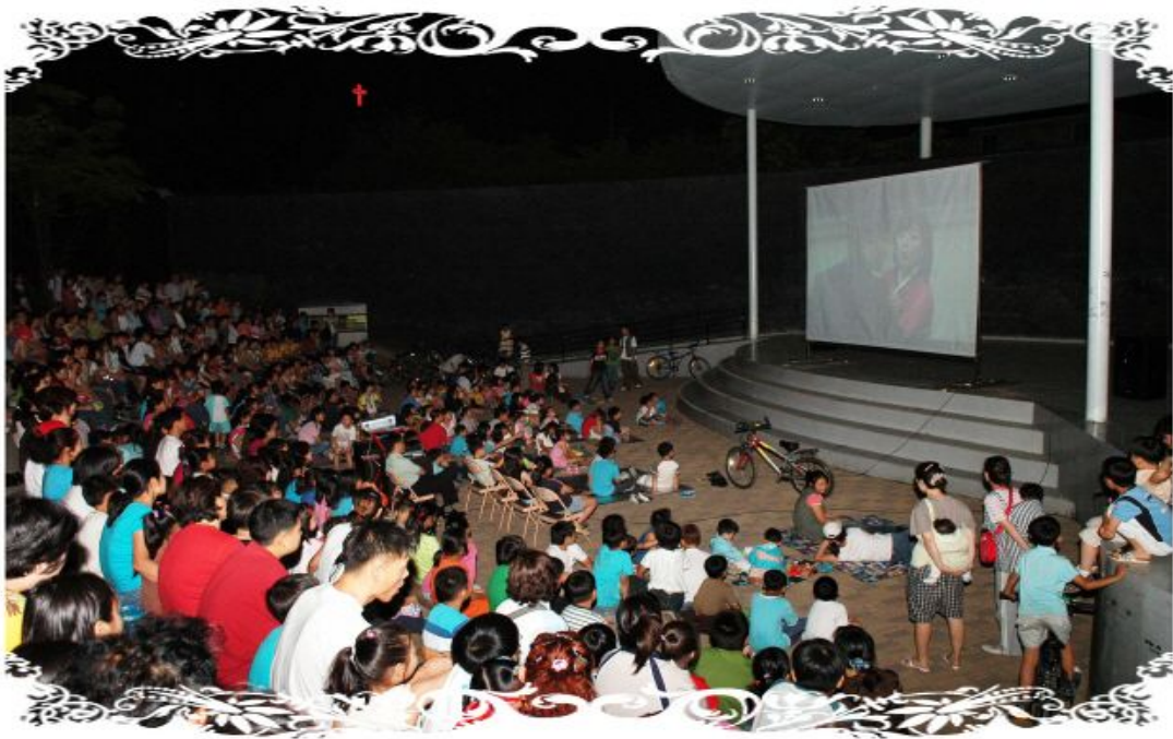
【 은데미예술마당 영화상영 】