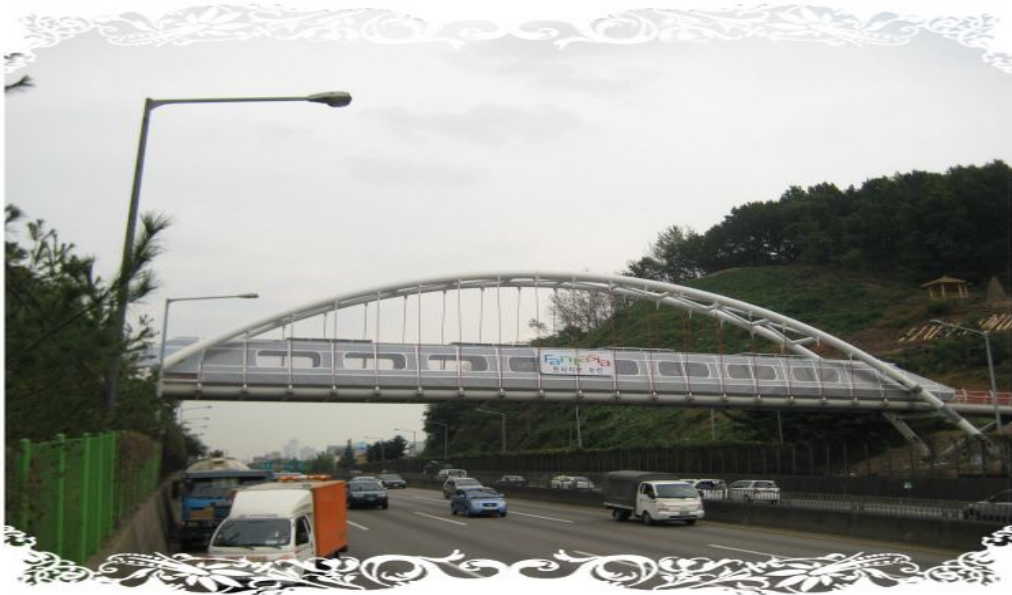
【 고리올 구름다리 】