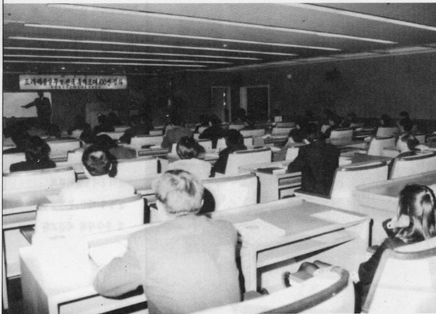
☞ 전국 특색조례 100선 강좌