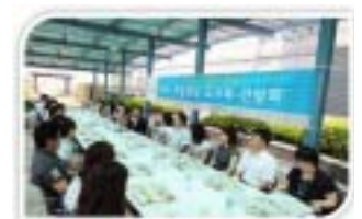
하늘정원 도시락 간담회