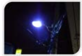
Blue Light 설치