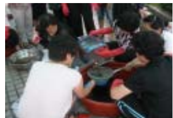
폐식용유 활용 EM비누만들기