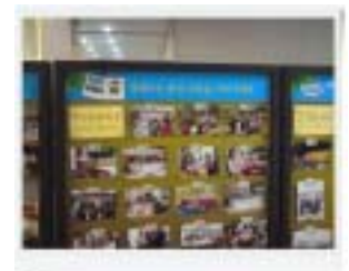
맘에드는 본인 사진 기적하세요