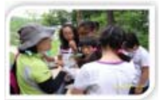
가족 숲 여행