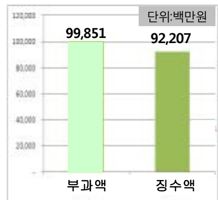
2010 지방세 과징현황