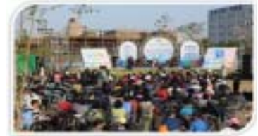
오정대공원 동호회 연주