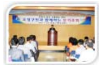
시민과 함께하는 분기조회