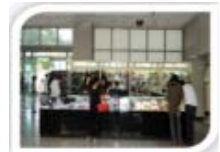
배고장 공산품 판매장