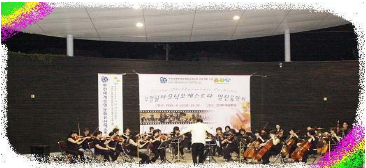
▶ 은데미 예술마당 '찾아가는 음악회' 공연