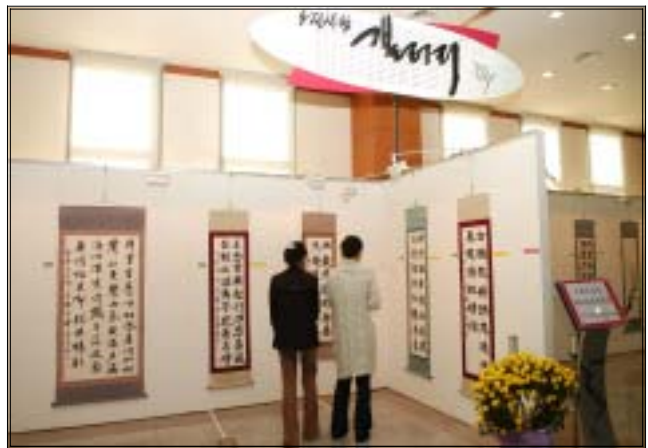
《 오정사랑 갤러리 작품 전시 》