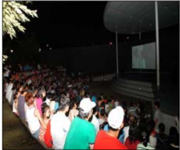
《 은데미예술마당 야간 영화상영 》