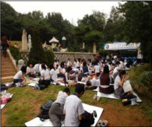
《 수주백일장 》